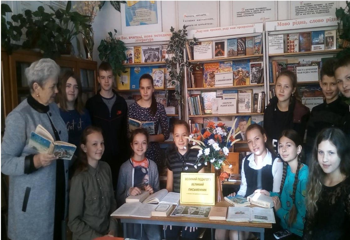
Година спілкування «Людина любові і добра»