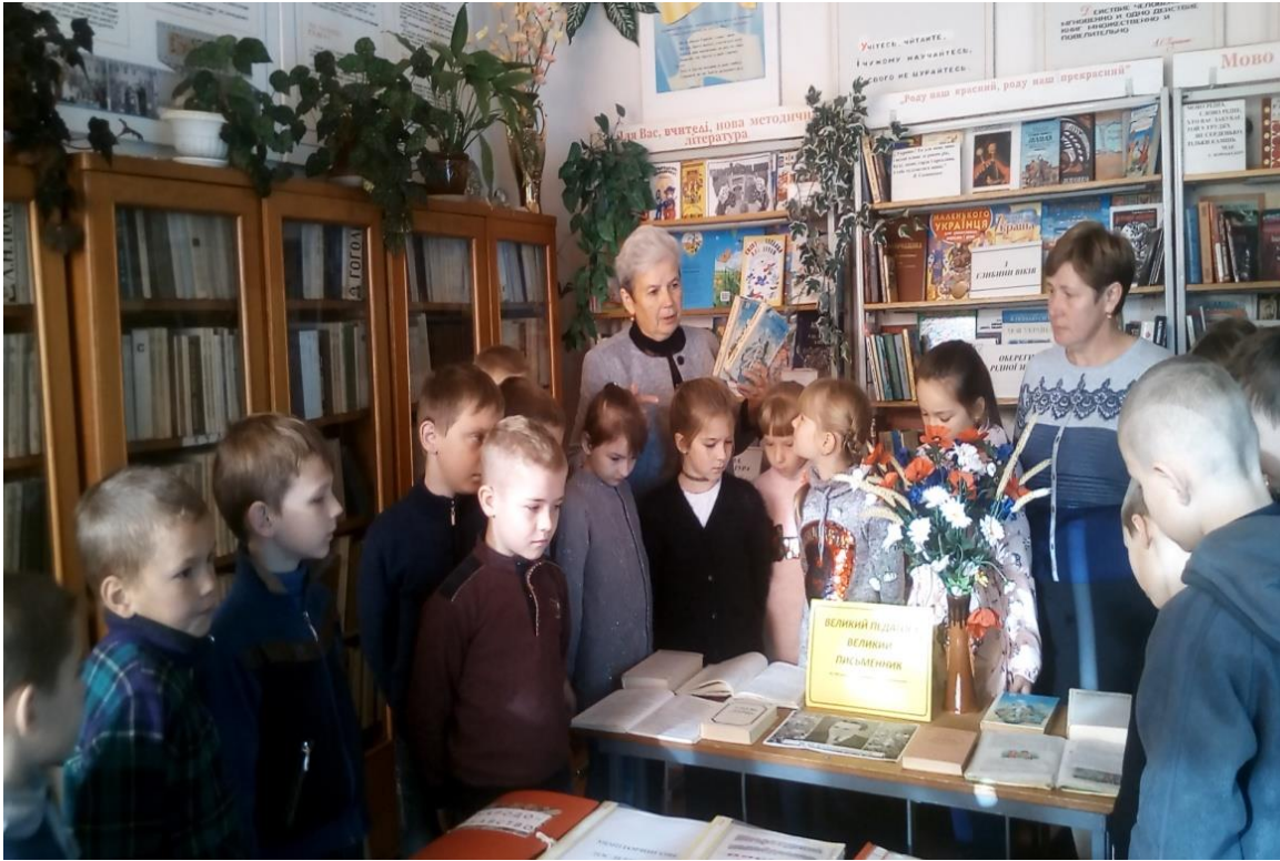
Книжкова виставка «Великий педагог і великий письменник»