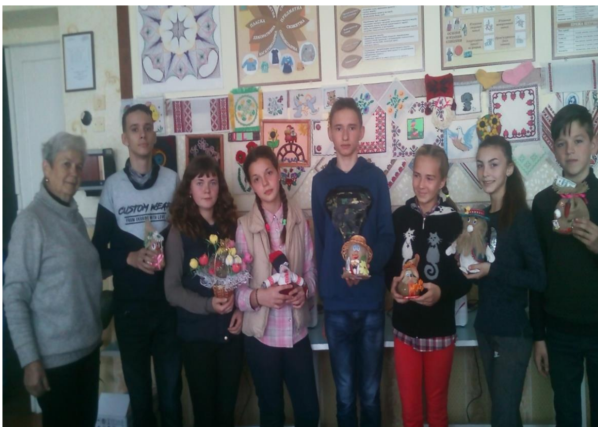
Виставка дитячої творчості «Майстровиті руки»