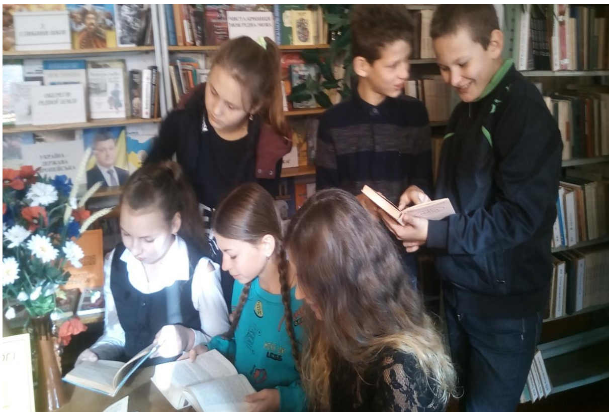
Голосні читання, обговорення оповідань, притч по творах В.О. Сухомлинського