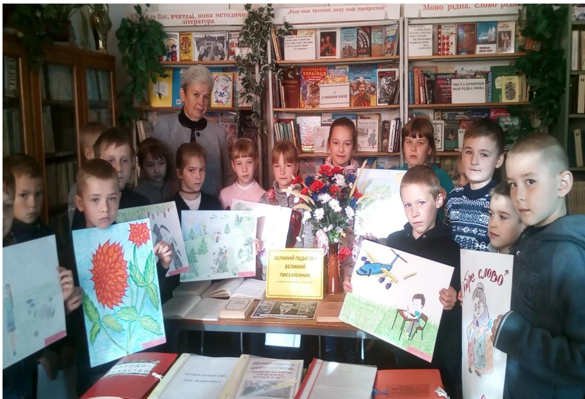
Конкурс дитячих малюнків до оповідань та казок В.О.Сухомлинського «Казка на кінчику пензля»