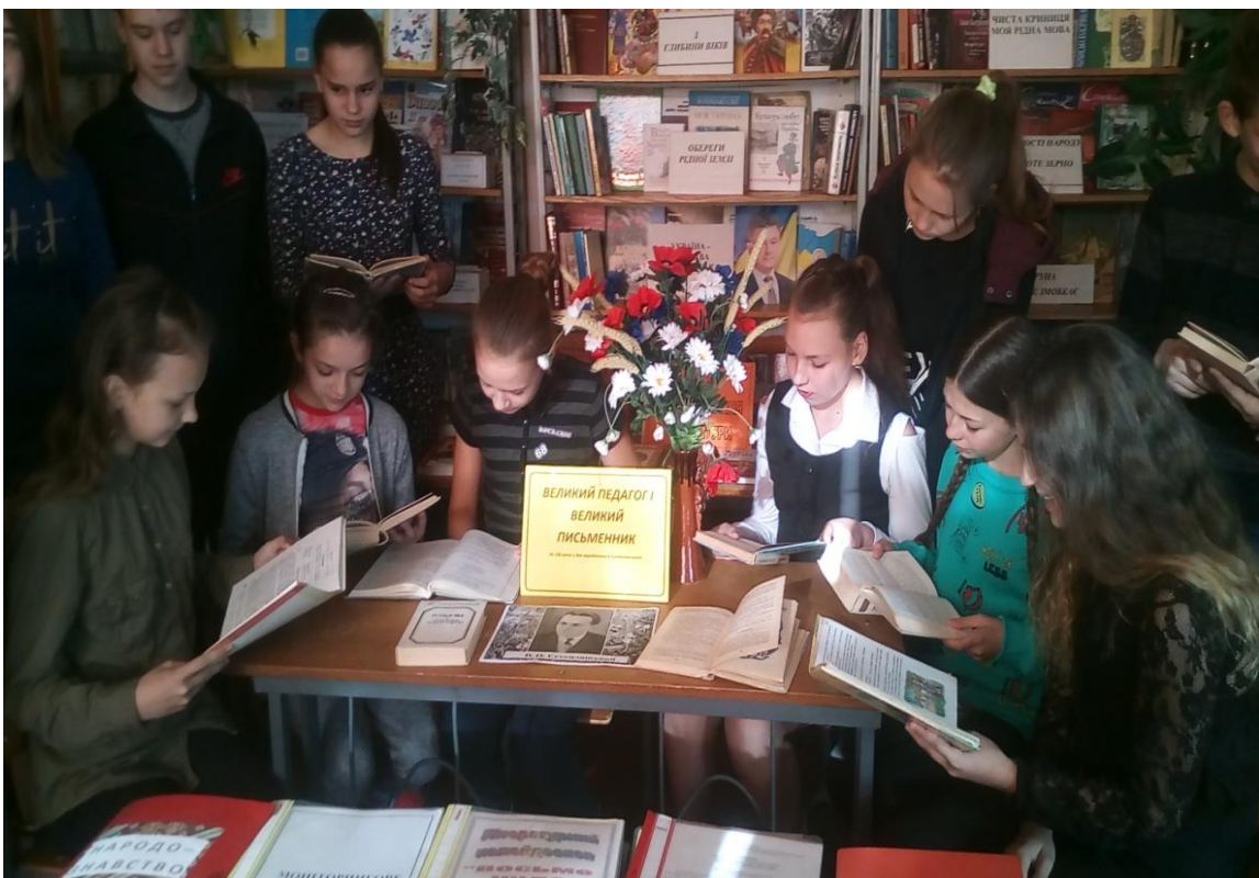
Круглий стіл «Творчість В.О.Сухомлинського – дітям»