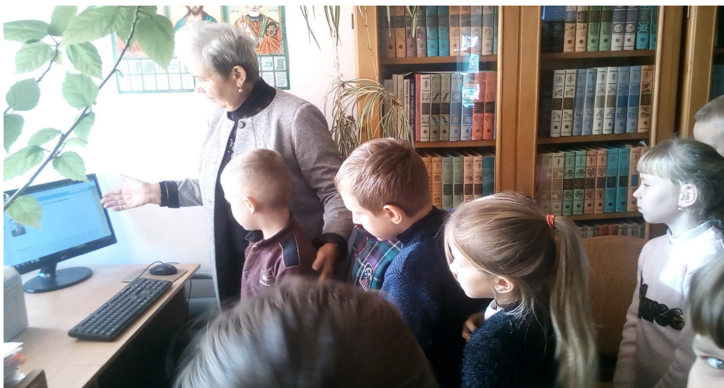
Перегляд відеоролика «Сучасні світові казкарі»