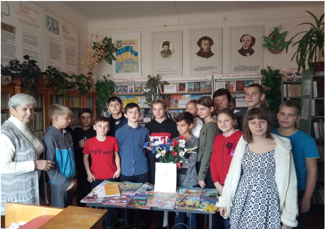
Книжкова виставка «Великий педагог і великий письменник»