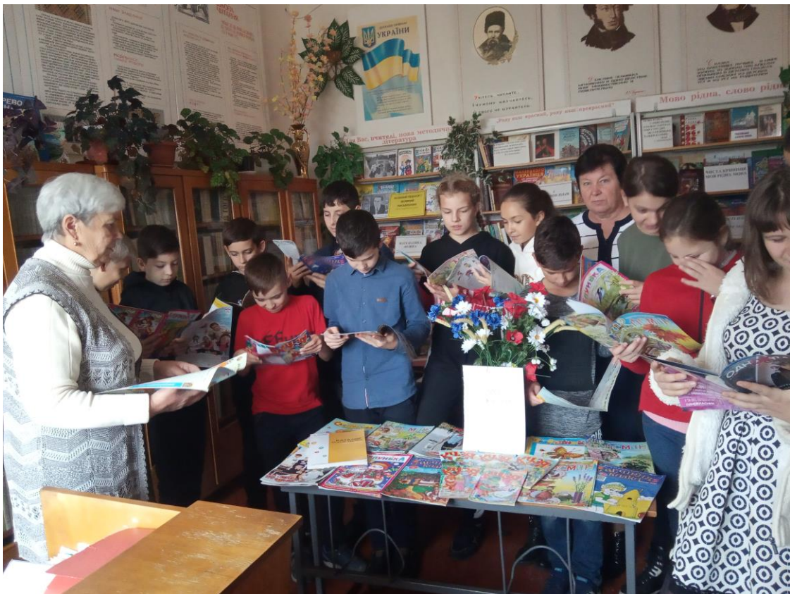
Бібліотечний урок «Щоб цікавинки всі знати газети та журнали потрібно читати»