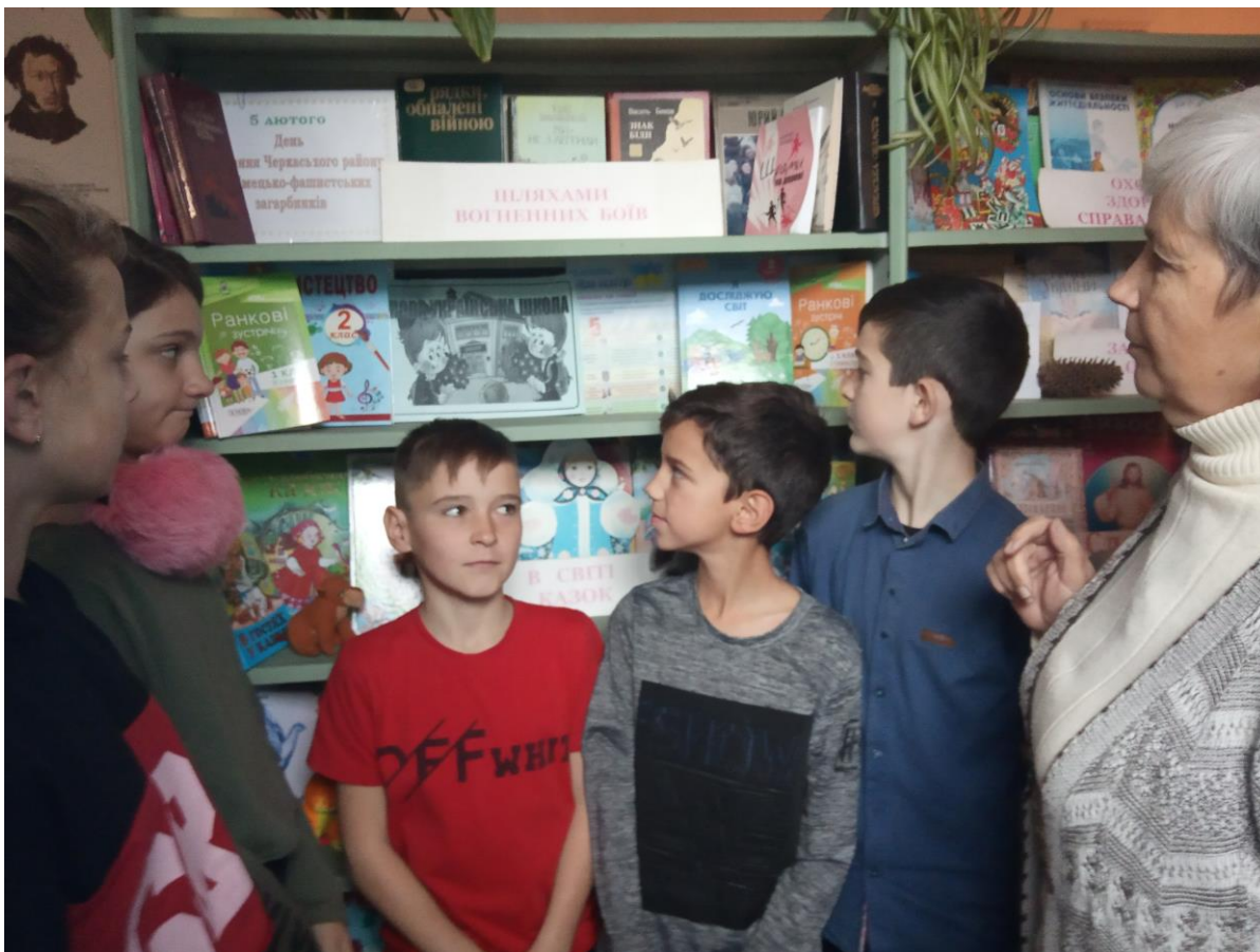
Оголошення про проведення всеукраїнського місячника шкільних бібліотек