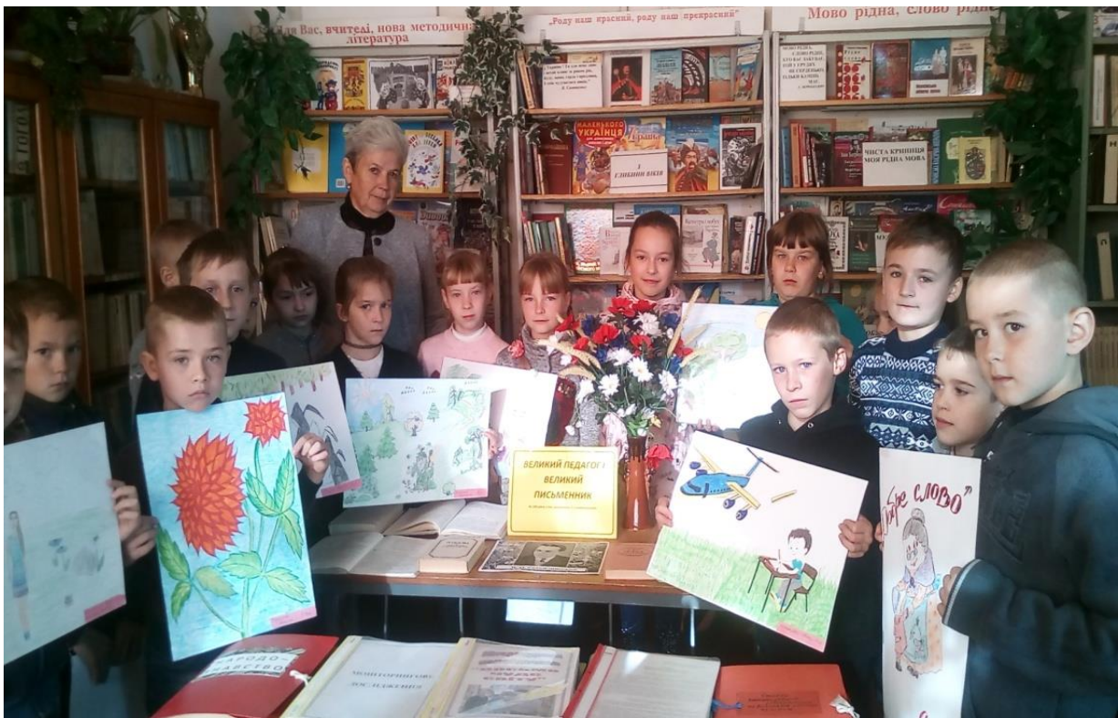
Конкурс дитячих малюнків «Наш вернісаж»