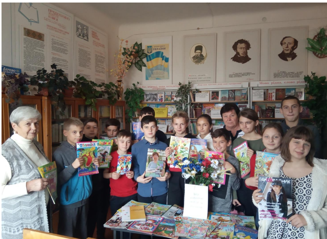
Перегляд нових надходжень газет та журналів