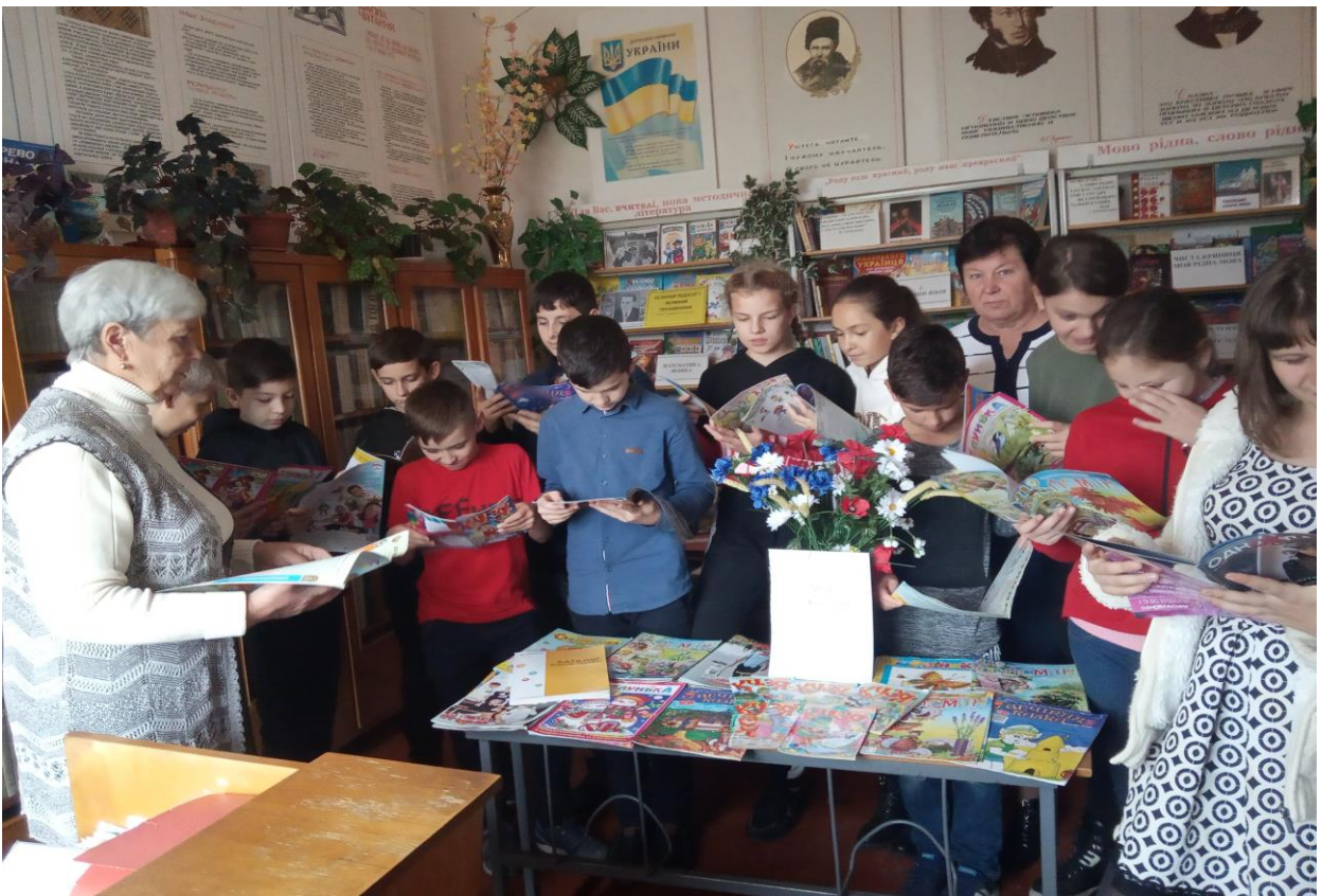
Бібліотечний урок «Щоб цікавинки всі знати газети та журнали потрібно читати»