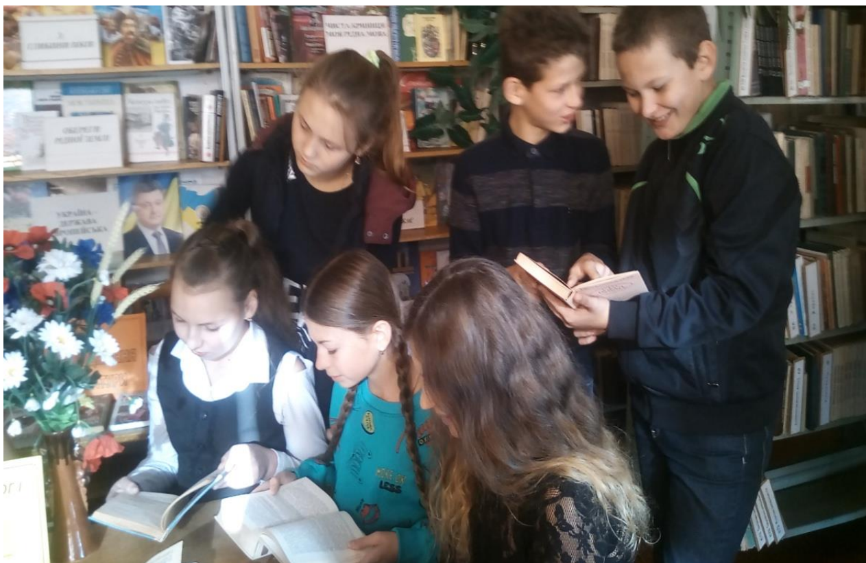
Голосні читання, обговорення оповідань, притч по творах