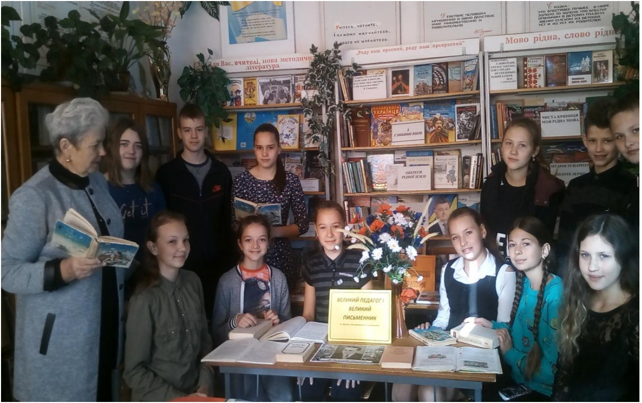
Година спілкування «Людина любові і добра»