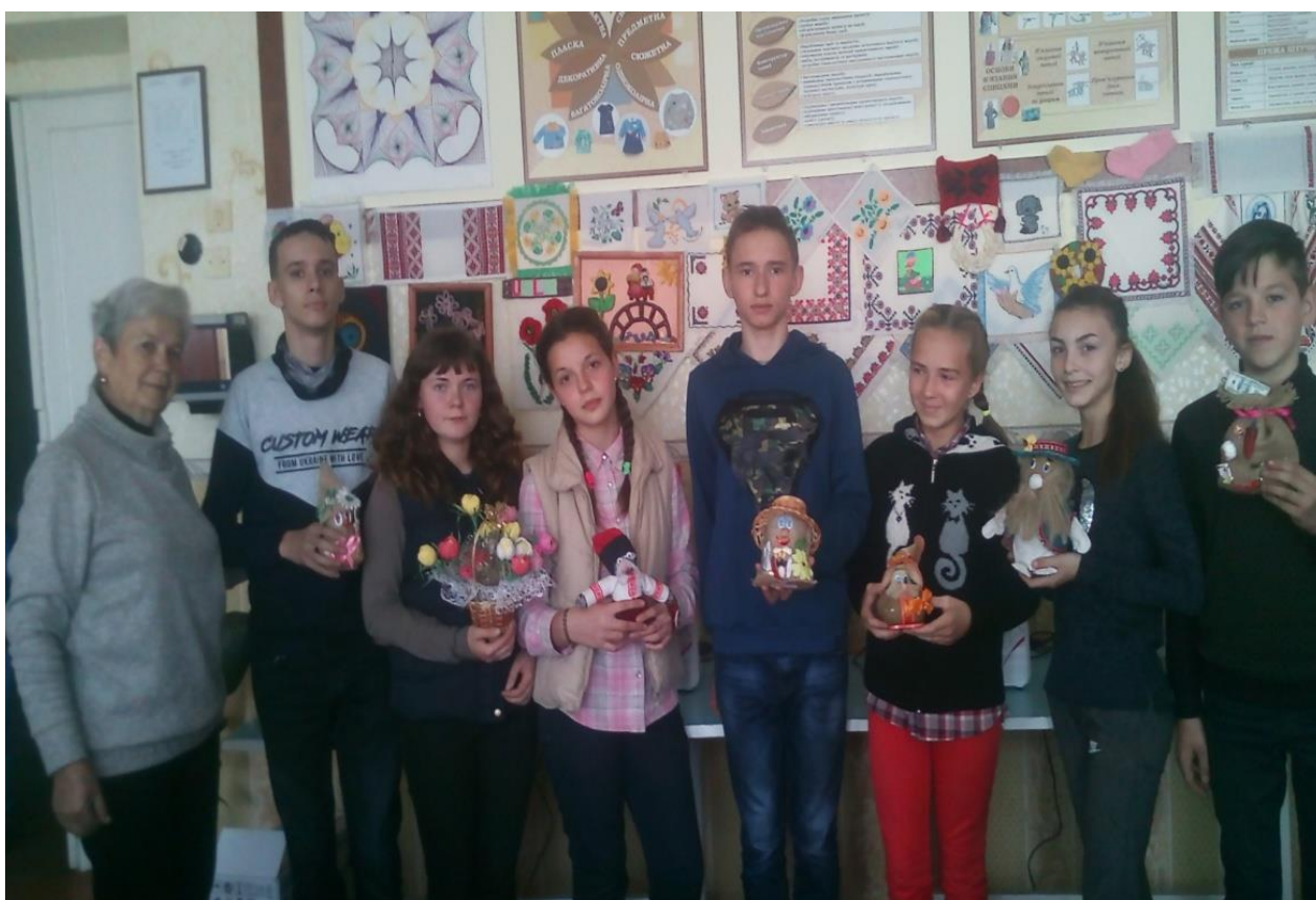
Виставка дитячої творчості «Майстровиті руки»